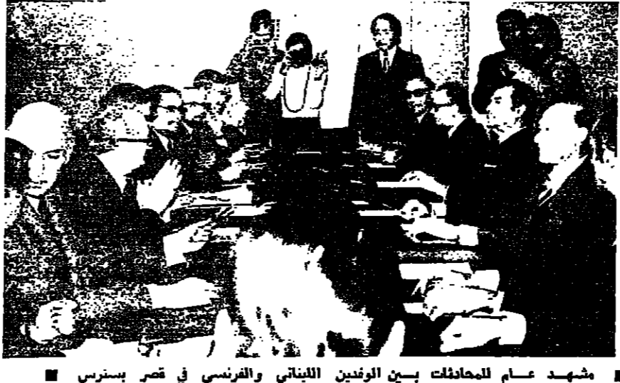
مشهد عام للمحادثات بين الوزير اللبناني والفرنسي في قصر بستانس

تمسكت الاضواء امس على المحادثات التي اجراها السيد لوي دوغرينغو ، وزير خارجية فرنسا مع الرئيس الياس سركييس ورئيس مجلس النواب السيد كامل الاسعد ورئيس الحكومة الدكتور سليم الحص ووزير الخارجية السيد فؤاد بطرس . وكانت المواضيع السياسية والاقتصادية التي تهم لبنان المناوئين البارزة لمحادثات الوزير الفرنسي مع كبار المسؤولين اللبنانيين . وفي جميع الاتصالات التي اجراها دوغرينغو امس : أكد